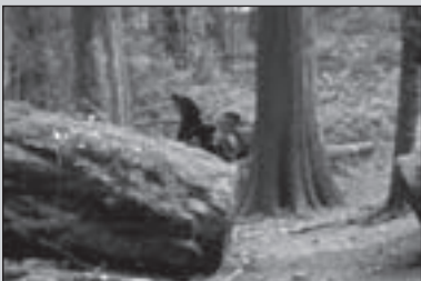
Wandelen in ongerept Canada